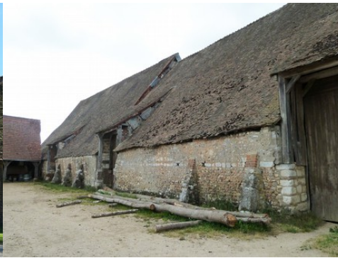
La grange vue de la cour du manoir