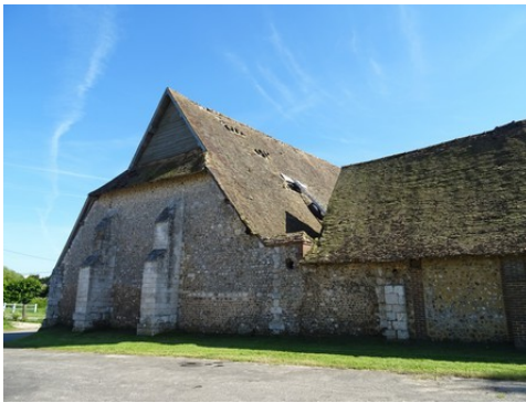
Le pignon nord de la grange