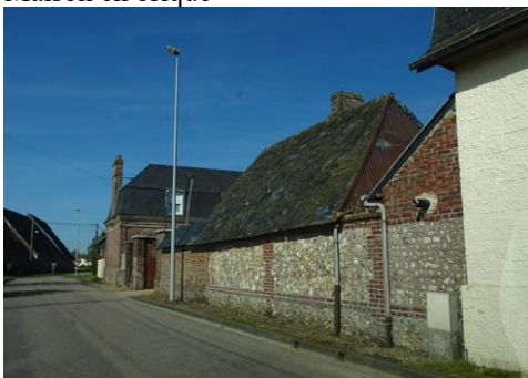
Face au monument