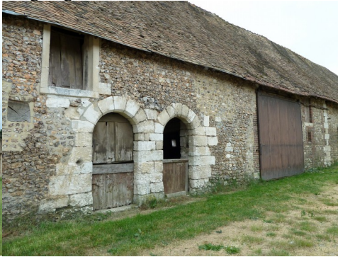
Les dépendances vues de la cour