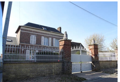
Maison en brique