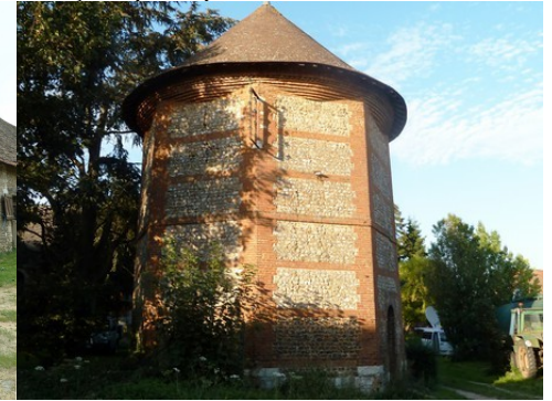
Le colombier octogonal du manoir