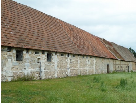
Les anciennes dépendances vues du Sud