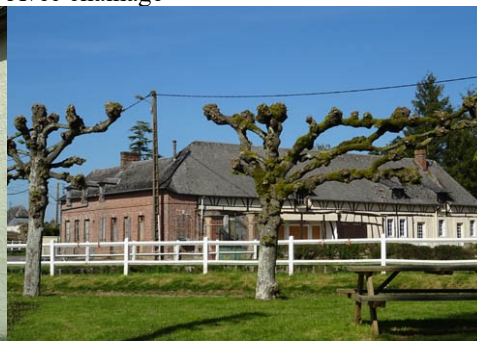
Au niveau de la place