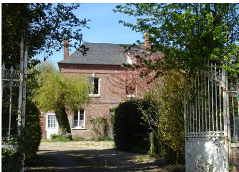
Maison en brique

Les avis seront cohérents avec ceux émis ces derniers années, à savoir : pas de maisons à volume compliqué (type V, W, Y, ou Z), pentes à 45° pour les volumes principaux, ardoise ou tuile plate de teinte brun vieilli, à 20u/m 2 , avec un débord de toiture de 20cm, enduit de teinte beige clair avec modénatures (au choix : chaînages, encadrement de fenêtres, soubassement, colombage...). *Voir les autres fiches.